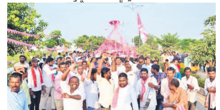
సిద్దిపేట ప్రజా ఆశీర్వాద సభకు జలవందిం, నృత్యాలు చేస్తూ వస్తున్న ప్రజలు