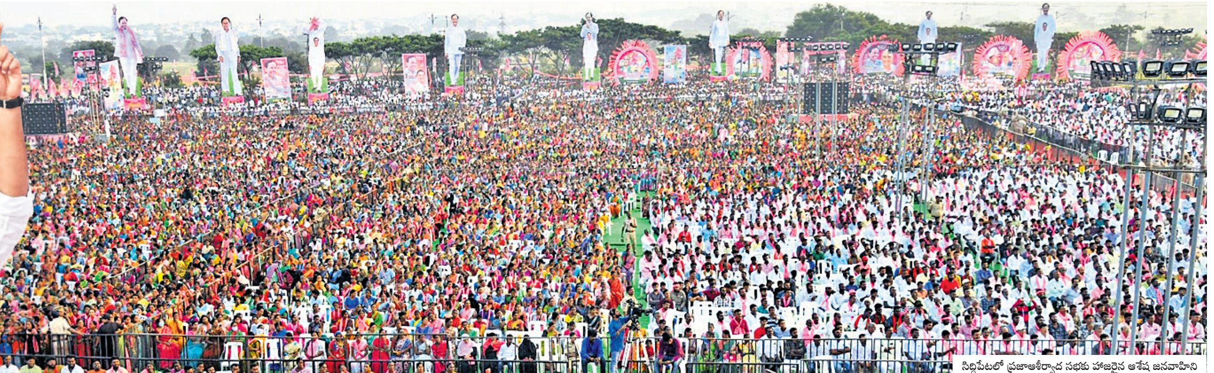
సిద్దిపేటలో ప్రజాఆశీర్వాద సభకు హాజరైన అనేక జనవాహినీ