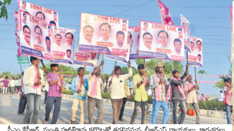
సీఎం కేసీఆర్, మంత్రి హరిశోరావు కటౌట్లతో తరలివస్తున్న బీఆర్ఎస్ నాయకులు, కార్యకర్తలు