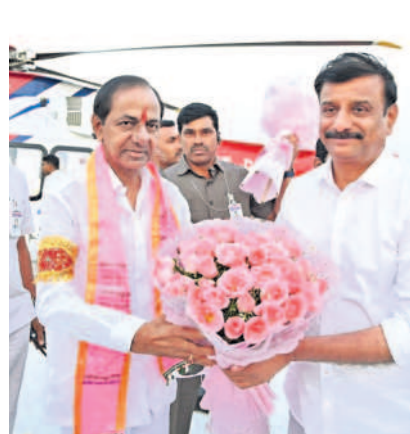
సీఎం కేసీఆర్ కు పుష్పగుచ్ఛం అందజేస్తున్న ఎంపీ కొత్త ప్రభాకర్ రెడ్డి