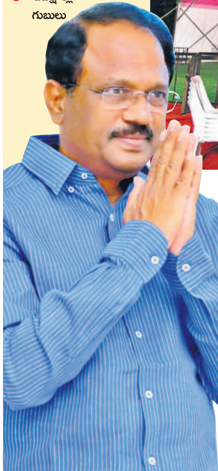
జడ్పీలో సిద్ధమైన సభావేదిక