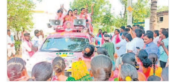
మల్ రెడ్డిపల్లిలో మాట్లాడుతున్న ఎమ్మెల్యే పట్నం నరేందర్ రెడ్డి