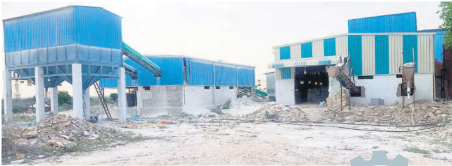
దామరచర్ల మండలం ఇల్కిగూడెంలో ఏర్పాటు చేసిన ముగ్గు మిల్లు