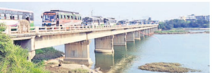
ప్రజాఅశీర్వాద సభకు వస్తున్న మహిళలు