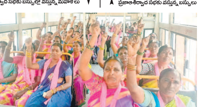
ప్రజాఅశీర్వాద సభకు వస్తున్న బిస్కెలు