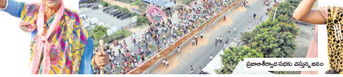
ప్రజాఅశీర్వాద సభకు వస్తున్న జనం