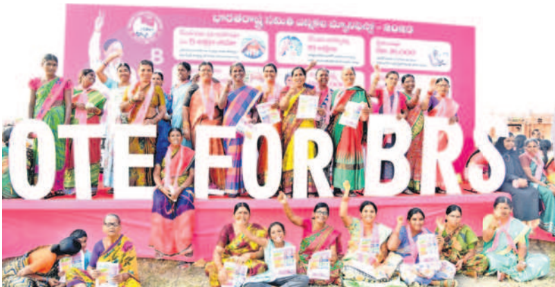
సభలో బీఆర్ఎస్ మ్యానిఫెస్టో స్టేజీ వద్ద నినాదాలు చేస్తున్న మహిళలు