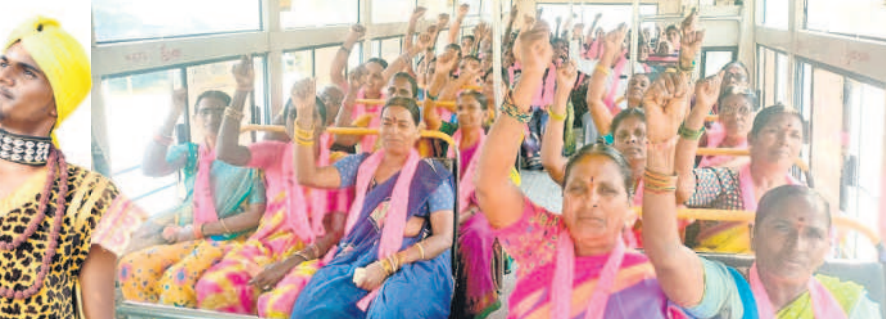
ప్రజాఅశీర్వాద సభకు వస్తున్న బస్సులు