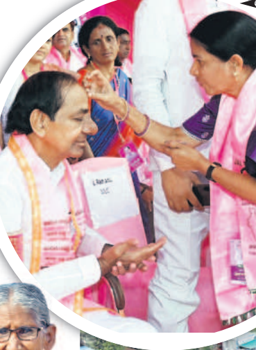
ముఖ్యమంత్రి కేసీఆర్ తో ఎమ్మెల్సీ రమణ మాటామంతి

ముఖ్యమంత్రి కేసీఆర్ కు బొట్టు పెడుతున్న జిడ్డి చైర్మన్ వర్మన్ న్యాలకొండ అరుణ