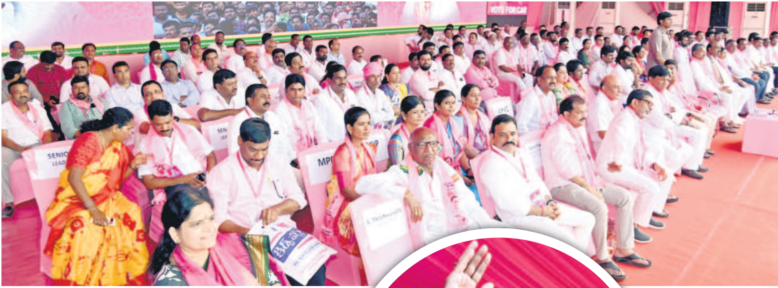
అపద మొక్కలో క్షణ నమస్కర్లు

అనేక అబద్ధాలతోటి, అనేక మోసపు మాటలతోటి అపద మొక్కలు మొక్కతూ వచ్చేవాళ్లు చాలా మంది ఉంటారు. ఒక మోసపు బట్టలు కుడుతుంది. ఆయన సూది కిందిపడిపోయింది. 'దేవుడా.. దేవుడా' వేములవాడ రాజన్న పాపమి, నా సూది నాకు దొరకని, నీ పేరు మీద పది కిలోల చక్కెర పంది పెడుతాని మొక్కతడు. ఇంట్లో ఉన్న బ్యాగ్లో వీని, నమస్కర్లు పది పైసల సూది కోసం.. పది కిలోల చక్కెర పందిపెడుతూ అని అంటే.. సూదికే దొరకని, చక్కెర ఎగవెడుతారు. దేవుడు ఏం చేస్తాడని అన్నాడట. అట్టుంటే అపద మొక్కలు మొక్కే వాళ్ల పరిస్థితి. యాళ్లకువచ్చి ఏది పడితే, అది చేస్తామని అంటారు.