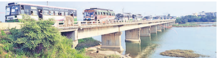
ప్రజాఅశీర్వాద సభకు బస్సుల్లో వస్తున్న మహిళలు