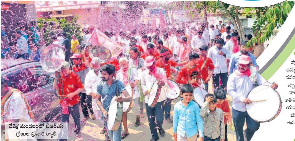
చేవెళ్ల మండలంలో బీఆర్ఎస్ శ్రేణుల ప్రచార ర్యాళీ