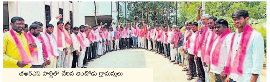
బీఆర్ఎస్ పార్టీలో చేరిన బిందోడు గ్రామస్తులు

బీఆర్ఎస్లో చేరిన వివిధ పార్టీల నాయకులు, కార్యకర్తలు సీఎం కేసీఆర్ చేపట్టిన సంక్షేమ పథకాలకు ఆకర్షితులవుతున్న జనం అన్ని వర్గాలకు సమప్రాధాన్యం కల్పిస్తున్నారా