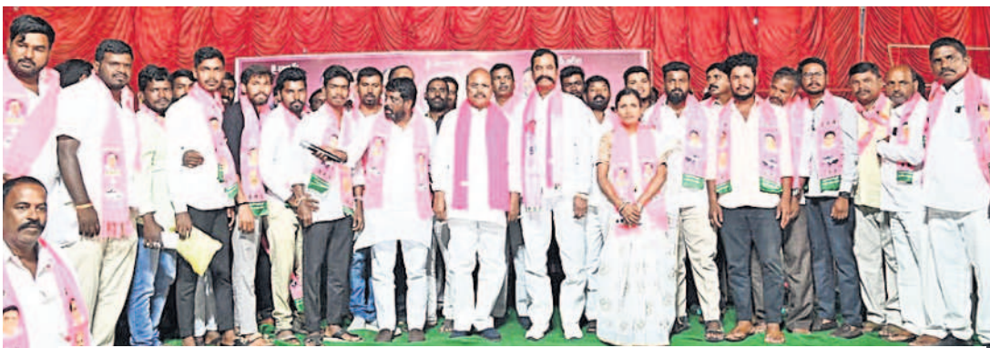
ఎమ్మెల్యే సమక్షంలో బీఆర్ఎస్ పార్టీలో చేరిన వివిధ పార్టీల కార్యకర్తలు