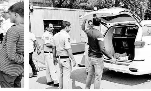
మొయినాబాద్ లో తనిఖీలు చేస్తున్న పోలీసులు