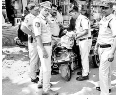
వికారాబాద్ లో వాహనాల తనిఖీ చేస్తున్న పోలీసులు