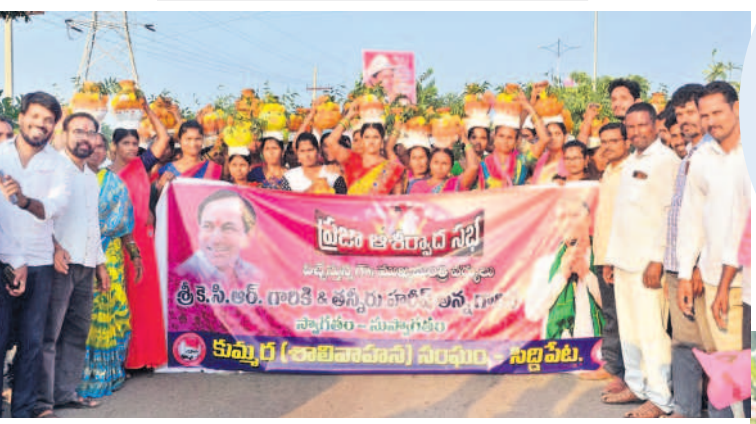
ప్రజా ఆశీర్వాద సభకు బోనాలతో వస్తున్న సిద్దిపేట శాలిహాన కుమ్మరి సంఘం సభ్యులు

-సిద్దిపేట ప్రతినిధి/సిద్దిపేట/సిద్దిపేట అర్బన్/దూరల్, అక్టోబర్ 17 (నమస్తే తెలంగాణ)