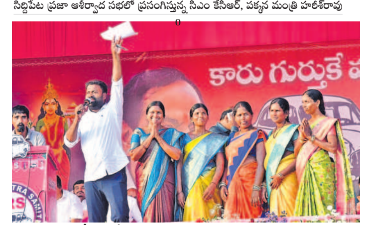
సిద్దిపేట ప్రజా ఆశీర్వాద సభలో ప్రసంగిస్తున్న సీఎం కేసీఆర్, పక్కన మంత్రి హరిశ్చంద్రారావు