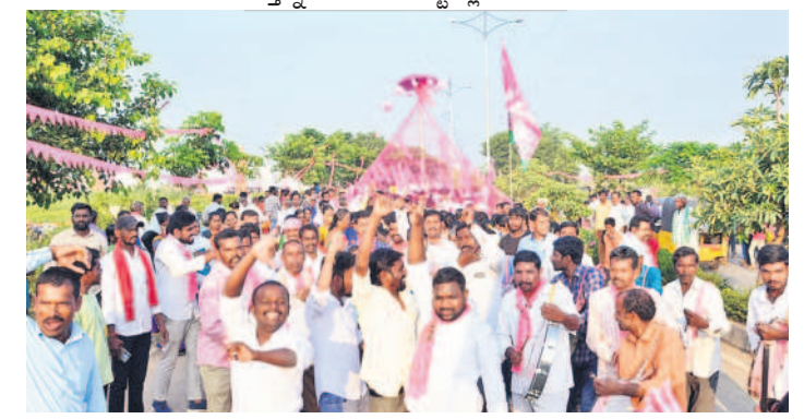
సిద్దిపేట ప్రజా ఆశీర్వాద సభకు జలవంది, నృత్యాలు చేస్తూ వస్తున్న ప్రజలు