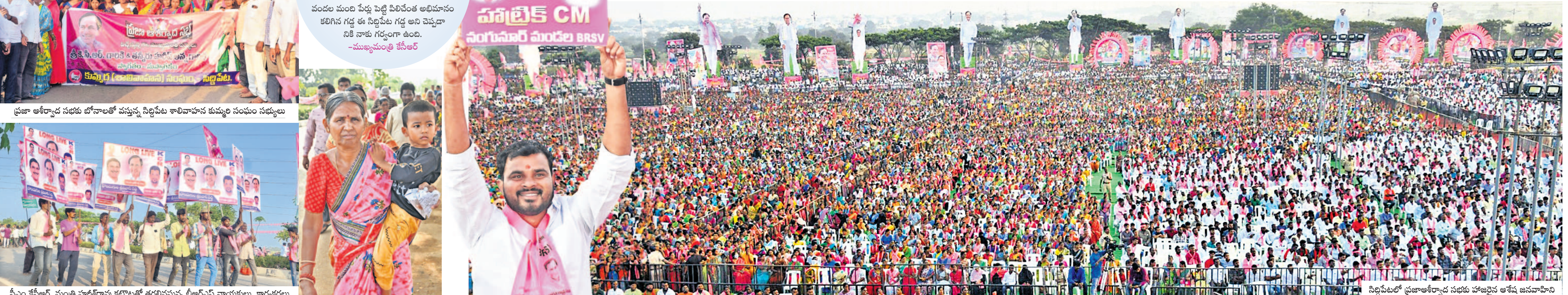
సిద్దిపేటలో ప్రజాఆశీర్వాద సభకు హాజరైన అనేక జనవాహినీలు