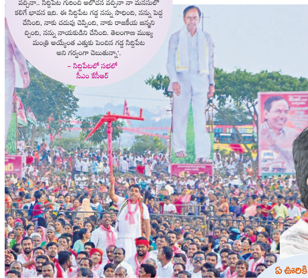
సిద్దిపేట ప్రజా ఆశీర్వాద సభలో నాగలి మాపుతున్న రైతు