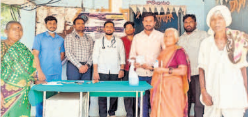
వైద్య శిబిరంలో మందులు పంపిణీ చేస్తున్న డాక్టర్లు