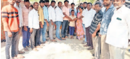
మృతుల కుటుంబాలకు ఆర్థిక సాయం అందజేస్తున్న మున్నూరుకాపు సంఘం నాయకులు

జగదేవ్ పూర్, అక్టోబర్ 17 : మండలంలోని తీగుల్ గ్రామంలో బతుకుమ్మ పండుగను పురస్కరించుకొని ఇటీవల చెరువు ఘాట్ వద్ద మెట్లను శుభ్రం చేసి క్రమంలో చెరువులో