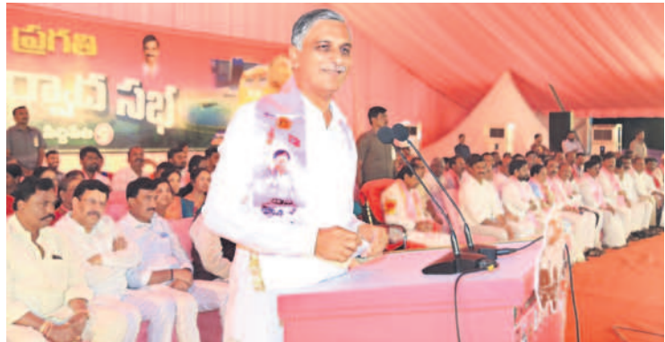
సిద్దిపేట ప్రజా ఆశీర్వాద సభలో మాట్లాడుతున్న మంత్రి హాజరీరావు

'ఒకనాడు మన ప్రాంతంలో భూముల ధర ఎకరానికి 4 లక్షలు, 5 లక్షలు ఉండే.. అమ్మాయికి పెండ్లి చేయాలన్న.. దవాఖానలకు ఖర్చులు పడ్డ.. అడ్డికిపాపుషేరకు ఎకరం భూమి అమ్ముకున్నం. సీఎం కేసీఆర్ రైతును బలోపేతం చేస్తే రైతు చేతిలో ఉన్న భూముల విలువ ఇవాళ ఆకాశమంత ఎత్తుకు ధరలు పెరిగినాయి' అని మంత్రి అన్నారు. ఇవాళ సిద్దిపేటలో ఎక్కడి వెళ్లినారూ. 50 లక్షలు, కోటి ఎకరం పలుకుతుండన్నారు. సీఎం రైతుల గౌరవాన్ని పెంచారన్నారు. కేసీఆర్ గురించి కొంత మందికి తెల్లదు.. కానీ, సిద్దిపేట బిడ్డలకు బాగా తెలుసు.. వారు ఎమ్మెల్యేగా ఉంటే చింతమడకలోని మైసమ్మకుంట్లలో వ్యవసాయం చేశారన్నారు. ఆనాడు కరువు మంత్రిగా ఉంటే వ్యవసాయం చేశారు. రవాణా శాఖ మంత్రిగా ఉంటే వ్యవసాయం చేశారు.. డిల్లీలో కేంద్ర మంత్రిగా ఉన్న వ్యవసాయం చేశారు. ఇవాళ రాష్ట్రానికి ముఖ్యమంత్రిగా ఉన్న ఈ రోజు కూడా వ్యవసాయం చేసే ఒక రైతు బిడ్డ.. నికార్సయిన రైతుబిడ్డ కేసీఆర్ అని అన్నారు. తెలంగాణ రైతు నాయకుడి చేతిలో ఉంది కనుకనే ఇవాళ ఈ రాష్ట్రంలోని రైతులందరూ సంక్షోభంగా ఉన్నారన్నారు.