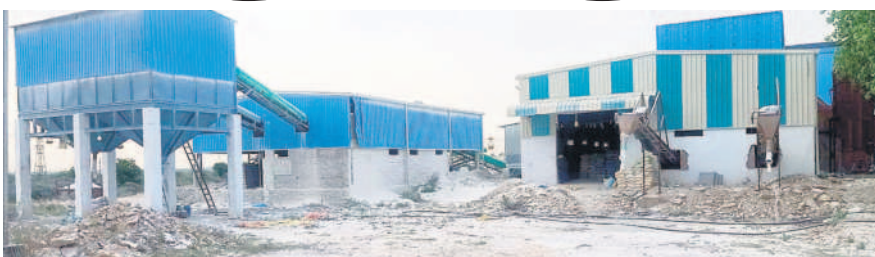
దామరచర్ల మండలం ఇర్లగూడెంలో ఏర్పాటు చేసిన ముగ్గు మిల్లు