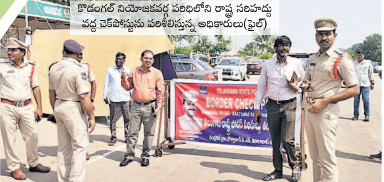
కొడంగల్ నియోజకవర్గ పరిధిలోని రాష్ట్ర సరిహద్దు వద్ద చెక్ పోస్టును పరిశీలిస్తున్న అధికారులు (ఫైల్)