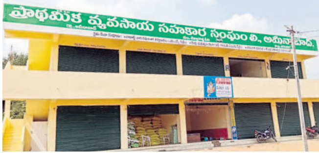
అమీనాబాద్ లో నిర్మించిన సహకార సంఘం భవనం

చెన్నారావుపేట, అక్టోబర్ 16: మండలంలోని అమీనా బాద్ ప్రాథమిక సహకార సంఘం అభివృద్ధి పథంలో పయనిస్తున్నది. ఈ సొసైటీ 30 గ్రామాల రైతులకు సేవలందిస్తూ.. అన్నదాతల సంక్షేమమే ధ్యేయంగా ముందుకు సాగుతున్నది. 1955లో స్థాపించిన సహకార సంఘం గత ప్రభుత్వాల నిర్లక్ష్యంలో ఎలాంటి అభివృద్ధికి నోచుకోలేదు. కేవలం ఒక గోడౌన్ లో కార్యాలయ పనులు నిర్వహించే