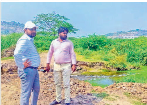
చెరువును పరిశీలిస్తున్న కమిషనర్ షేక్ రిజ్వాన్ బాషా

వరంగల్, అక్టోబర్ 17 : భద్ర కాళీ చెరువులోకి మురుగునీరు చేరకుండా ప్రత్యేక చర్యలు తీసుకోవాలని గ్రేటర్ కమిషనర్ షేక్ రిజ్వాన్ బాషా అధికారులను ఆదేశించారు. మంగళవారం ఆయన భద్రకాళీ చెరువు ప్రాంతాన్ని క్షేత్ర స్థాయిలో పరిశీలించారు. జయ నర్సింగ్ కాలేజీ సమీపం నుంచి చెరువులోకి మురుగు నీరు రాకుండా పనులు మొదలు పెట్టాలని అన్నారు. చెరువు ప్రాంతంలోని గుంతలు పూడ్చివేయాలన్నాడు. ఎఫ్ఐటీఎల్ ప్రాంతాన్ని గుర్తించి, సమగ్ర నివేదిక అందజేయాలని టౌన్ ప్లానింగ్ అధికారులను ఆదేశించారు. కమిషనర్ వెంట సిఎంహెచ్ఎం డాక్టర్ రాజేశ్, తదితరులు ఉన్నారు.