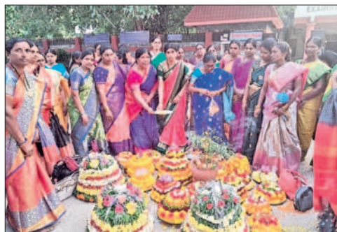
కేయూలో బతుకమ్మ సంబురాలను ప్రారంభిస్తున్న వీసీ రమేష్ సతీమణి భావన

ప్రభుత్వ జూనియర్ కాలేజీలో.. తెలంగాణ సంస్కృతి, సంప్రదాయాలకు ప్రతీక బతుకమ్మ పండుగ అని హను