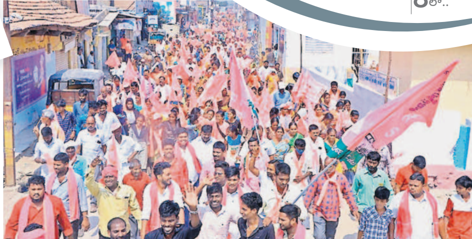
రామన్నపేటలో రోడ్ షాలో పాల్గొన్న బీఆర్ఎస్ శ్రేణులు, కార్యకర్తలు, ప్రజలు