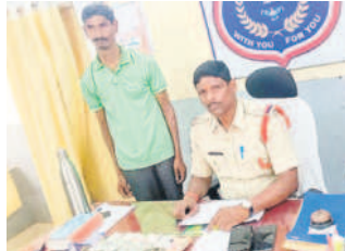
వలిగొండలో ఓ వ్యక్తి నుంచి నగదు స్వాధీనం చేసుకున్న పోలీసులు