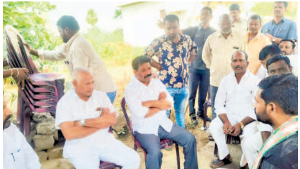
సత్రయ్య కుటుంబ సభ్యులను పరామర్శిస్తున్న ఎమ్మెల్యే పైళ్ల శేఖర్ రెడ్డి