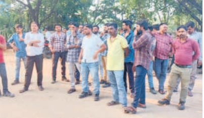
కెమికల్ లైఫ్ కంపెనీలో ఆందోళన చేస్తున్న కార్మికులు