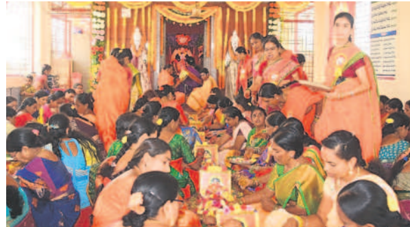
భూదాన్ పోచంపల్లిలో మద్దెలమ్మ దేవి ఆలయంలో లక్ష పుష్పార్చనలో పాల్గొన్న భక్తులు

భూదాన్ పోచంపల్లి, అక్టోబర్ 17 : దేవీ శరన్నవరాత్రోత్సవాల్లో భాగంగా పట్టణంలోని మద్దెలమ్మ దేవి ఆల