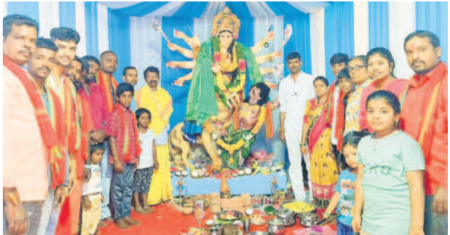
బొమ్మలారామారం : అన్నపూర్ణ దేవి పూజల్లో పాల్గొన్న యాత్ర సభ్యులు