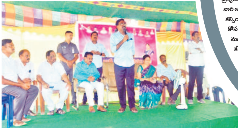
మాట్లాడుతున్న మంత్రి పువ్వాడ అజయ్ కుమార్