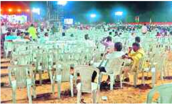
ములుగులో రాహుల్ ప్రసంగిస్తున్న సమయంలో జనం లేక బాళిగా ఉన్న కుర్చీలు

రాష్ట్రంపై విషం కక్కిన రాహుల్ గాంధీ, ప్రియాంక • తెలంగాణలో అమలుతున్న పథకాలపై అసత్య ప్రచారం • పాత స్మార్టునే మళ్లీ వడ్డీవేసిన హస్తం పార్టీ జాతీయ నాయకులు