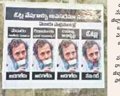
రాహుల్ వర్షటన నేపథ్యంలో ములుగు జిల్లా రాజమంజారిలో మరల రాజకీయ మేధావరం పోర్టుల్లో విలక్షణం మేధావరం జాతరకు జాతీయ హోదా గిరిజన వర్షటన మాట్లాడని రాహుల్.. ఓట్ల కోసం జిల్లాకు వస్తున్నారంటూ పోర్టుల్లో రాసి ఉంది. -ములుగు

సమస్యపడుతూ గాక నాకేటి సిగ్గు అన్న చందంగా ఉంది రాహుల్ గాంధీ తీరు. రాహుల్ గాంధీ అమాత్యత్వాన్ని చూసి తెలంగాణ రైతులు జాలి పడుతున్నారు. దేశంలో మరే రాష్ట్రం కొనుగోలు చేయని విధంగా రైతులు రెండు రెండు ప్రతి గింజను తెలంగాణ ప్రభుత్వం కొనుగోలు చేస్తున్నది. కాంగ్రెస్ అధికారంలో ఉన్న చిత్తీగడ్డలో ఎకరానికి 16 క్వింటాళ్ల ధాన్యం మాత్రమే కొనుగోలు చేస్తూ రైతులను ఇబ్బందులకు గురి చేస్తున్నది.