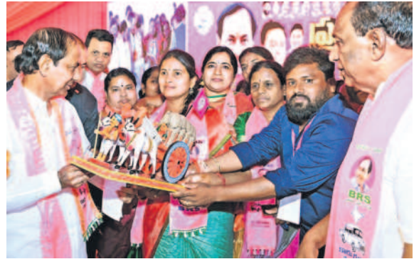
ముఖ్యమంత్రి కేసీఆర్ కు జ్ఞాపికను అందజేస్తున్న మేడ్చల్ నియోజకవర్గం నేతలు