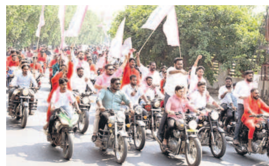
నగరంలో బీఆర్ఎస్ శ్రేణుల బైక్ ర్యాలీ