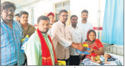
కోరుట్ల: బాలింతకు పండ్లు పంపిణీ చేస్తున్న నాయకులు