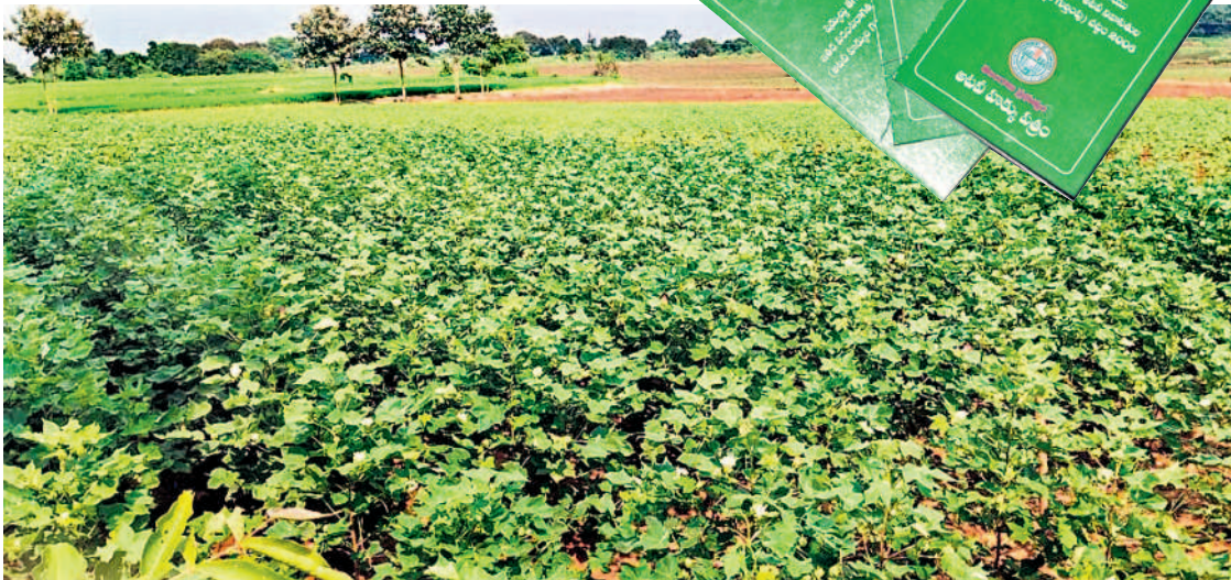
లెంకలగడ్డలో పోడు భూమిలో సాగువుతున్న పత్తి పంట