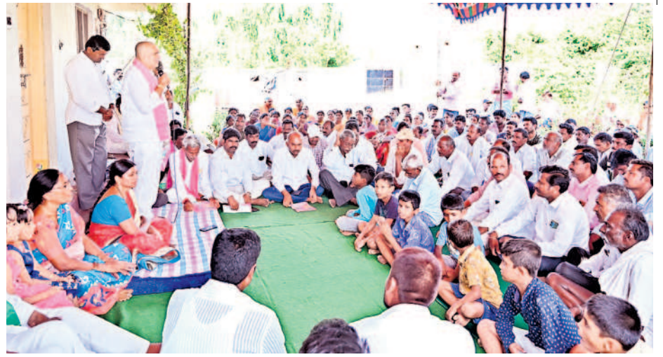
ముగ్గుళ్లపల్లి మండలం మెట్టపల్లి గ్రామంలో కార్యకర్తలతో మాట్లాడుతున్న ఎమ్మెల్యే గండ్ల వెంకటరమణారెడ్డి

ఏండ్లుగా భూమిని నమ్ముకుని బతుకుతున్న వారికి రాష్ట్ర ప్రభుత్వం అండగా నిలిచింది. అడవిని ఆధారంగా చేసుకొని పోడు సాగు చేసుకుంటున్న వారికి హక్కులు కల్పించి పట్టాలు పంపిణీ చేసింది. గిరిజనుల దశాబ్దాలనాటి కలను నెరవేర్చి అటవీ శాఖ వేదింపులకు పుల్ స్టాప్ పెట్టింది. జయశంకర్ భూపాలపల్లి జిల్లాలో 3,210 మంది రైతులు లబ్ధి పొందారు. భూపాలపల్లి నియోజకవర్గంలోని ఐదు మండలాల్లో 33 గ్రామ పంచాయతీల పరిధిలో 51 హాబిషఫ్ట్లో 817 మంది రైతులకు 2,756 ఎకరాలకు పోడు పట్టాలు అందాయి. మంథని, భూపాలపల్లి నియోజకవర్గాల మధ్య పోడు భూములు సగానికి పైగా మంథని నియోజకవర్గంలో ఉండడంతో రెవెన్యూ పరంగా పట్టాలకు నోచుకోలేదు. ఈ విషయాన్ని ఎమ్మెల్యే గండ్ల ప్రభుత్వం దృష్టికి తీసుకెళ్లి పరిష్కారానికి కృషి చేశారు. అటవీ శాఖ వేదింపులు తప్పడంతో గిరిజనులు స్వేచ్ఛగా సాగు చేసుకుంటూ రైతుబంధును సైతం అందుకుంటున్నారు.