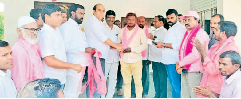
కందువాల కప్పి పార్టీలోకి ఆహ్వానిస్తున్న బీఆర్ఎస్ జిల్లా అధ్యక్షుడు కాకులమర్రి