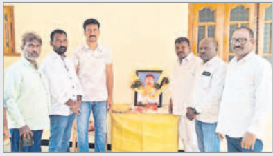
డైరెక్టర్ను పరామర్శిస్తున్న నాయకులు