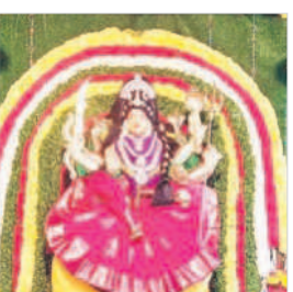
కూష్మాండదేవి అవతారంలో దర్శనమిస్తున్న జోగుళాంబ