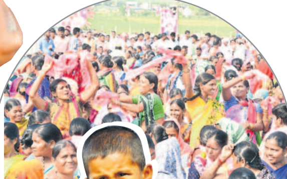
సభా ప్రాంగణంలో సృష్టించే వస్తున్న మహిళలు