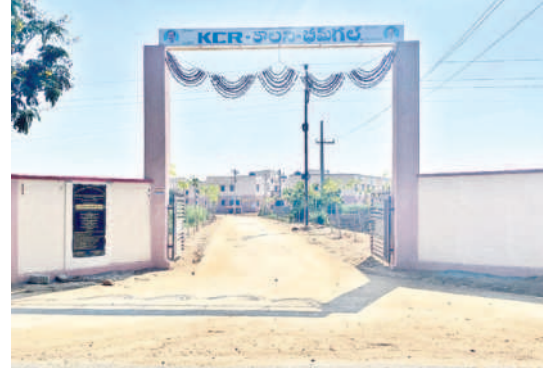
గుడు లేని వేదలకు ఉచితంగా ఇండ్లు అందించాలన్న ఉద్దేశంతో డబుల్ బెద్దాల పథకం కొనసాగుతున్నది. ఇందులో భాగంగా భీమగల్ పట్టణంలో రూ. 14.15 కోట్లతో 288 ఇండ్లను నిర్మించడమే కాకుండా మౌలిక వసతులైన సీసీ రోడ్లు, డ్రైనేజీలు, వాటర్ ట్యాంక్, వీధి దీపాలను ఏర్పాటు చేశారు.