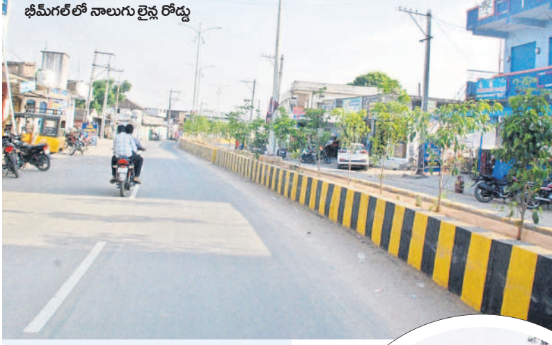
భీమగల్లో నాలుగు రైల్వే రోడ్లు