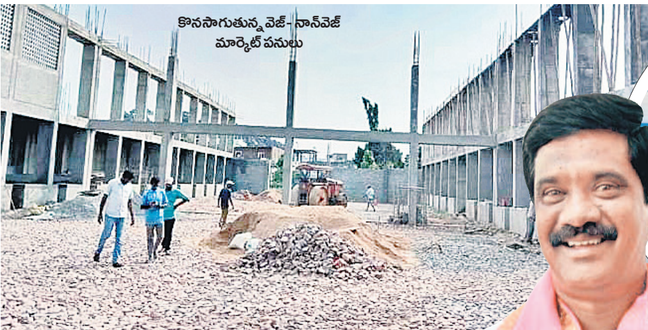
కొనసాగుతున్న వెజ్-నాన్ వెజ్ మార్కెట్ పనులు

అధ్యక్షుని రోడ్డు.. రాత్రులు వాలు వారున్న చీకట్లో.. తాగునీటి కోసం ఇక్కట్లు.. సరైన వైద్య పనులు లేక రోగుల బాధలు.. దుర్బంధం వెదజల్లే రోడ్లు, మురికి కాలువలు.. ఇది మేజర్ గ్రామ పంచాయతీగా ఉన్నప్పటి భీమగల్ దుస్థితి. సమైక్య పాలనలో ఎన్నో ప్రభుత్వాల పచ్చావు కానీ.. భీమగల్ పనులు కచ్చాలు తీరలేదు. తెలంగాణ ఏర్పాటు అనంతరం భీమగల్ ప్రజలు సమస్యలు పరిష్కారమవుతూ పచ్చాయి. తొమ్మిదేండ్లలో అద్దలూ మిసి రోడ్లు వేశారు. తాగునీటి కష్టాలు తీరాయి. కాంటిన్ల సీసీ రోడ్లు, డ్రైనేజీల నిర్మాణం, వీధులన్నీ ఎల్ఈడీ లైట్లతో జగితలూరు తయారయ్యాయి. స్వరాష్ట్రంలో ఏర్పడిన తొలి ప్రభుత్వం చేపట్టిన అభివృద్ధి పనులతో భీమగల్ పనులు హర్షం వ్యక్తంచేస్తున్నాయి.