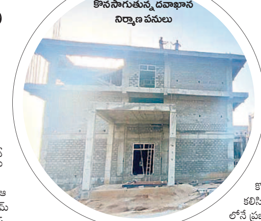
కొనసాగుతున్న దవాఖాన నిర్మాణ పనులు

భీమగల్, ఆక్టోబర్ 18: భీమగల్ ఒకప్పుడు నిజాంబాద్ జిల్లాలో మేజర్ గ్రామ పంచాయతీ. సమస్యలతో సామాన్యం చేస్తున్న జీవితం. రోజురోజుకూ పెరుగుతున్న పట్టణ విస్తరణతో మౌలిక వసతుల కల్పన లేమి కొట్టిబిచ్చినట్లు ఉండేది. దీంతో స్థానిక ఎమ్మెల్యే అయిన రాష్ట్ర రోడ్డు, భవనాలు, గృహనిర్మాణ శాఖ మంత్రి వేముల ప్రశాంత్ రెడ్డి.. భీమగల్ అభివృద్ధికి ప్రణాళికలు రూపొందించారు. జనాభా ఎక్కువగా ఉన్న భీమగల్ ను మున్సిపాలిటీగా మార్చి నిధుల కొరత ఉండడనే ఉద్దేశంతో సీఎం కేసీఆర్, మంత్రి కేటీఆర్ సహకారంతో పురపాలక ఏర్పాటు చేయించారు. దీంతో అప్పటి నుంచి భీమగల్ దశ మారింది. తెలంగాణ అర్బన్ మైన్స్ ఇన్ ఫ్రాస్ట్రక్చర్ అండ్ డెవలప్ మెంట్ కార్పొరేషన్ ద్వారా మౌలిక వసతుల కల్పనకు రూ. 35 కోట్ల నిధులను మంజూరు చేయించారు. వాటితో సీసీ రోడ్లు, డ్రైనేజీలు, బీటీ రోడ్లు తదితర పనులను ప్రారంభించారు. ఆ పనులు 90 శాతం పూర్తయ్యాయి.