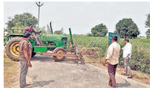
కొల్వారం: కోనాపూర్కు వెళ్లే రోడ్డుపై ముళ్ళపాదలను డోజర్తో తొలిగిస్తున్న గ్రామస్థులు