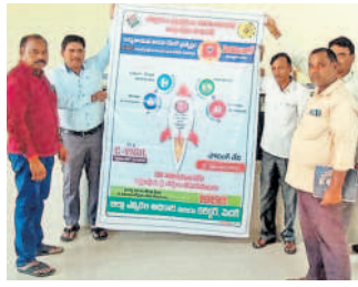
కొల్వారం: ఎన్నికల ప్రవర్తన నియమావళిపై సూచనలిస్తున్న తహసీల్దార్