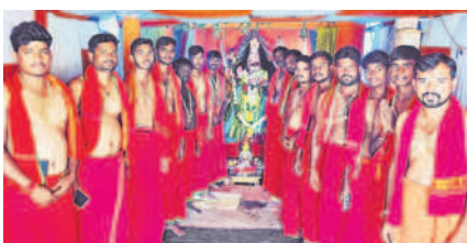
మడూరులో అమ్మవారికి పూజలు నిర్వహిస్తున్న భక్తులు