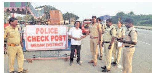
దామరచెర్వు హైవే వద్ద వాహనాలు తనిఖీ చేస్తున్న పోలీసులు