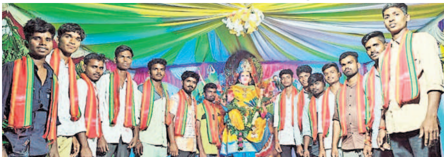
చిలిపిచెడ్: జగంపేటలో దుర్గామాతకు ప్రత్యేక పూజలు నిర్వహిస్తున్న యువకులు