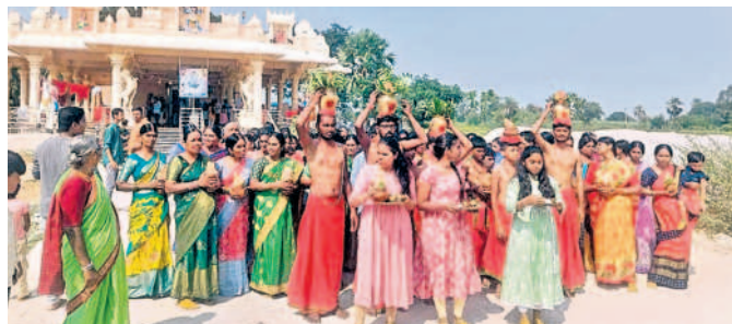
అమ్మవారికి జలాభిషేకం కోసం నదుల జలాలను ఊరేగింపుగా తీసుకొస్తున్న కౌండన్య యాత్ సభ్యులు, గ్రామస్థులు