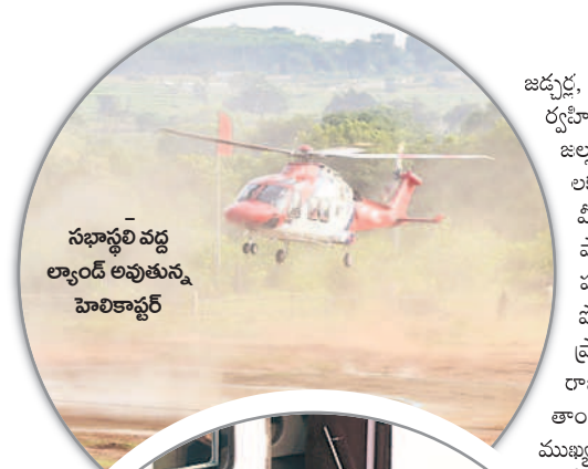
సభాస్థలి వద్ద ల్యాండ్ లాండు అవుతున్న హెలికాప్టర్