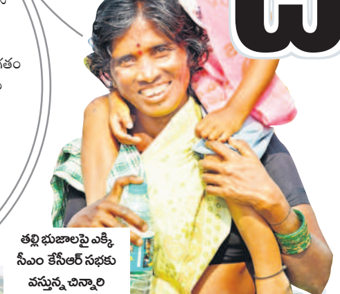
తల్లి భజాలపై ఎక్కి సీఎం కేసీఆర్ సభకు వస్తున్న చిన్నారు