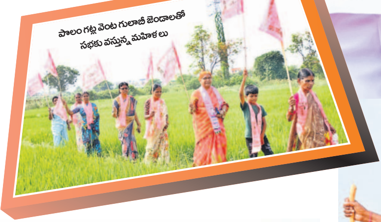
పాలం గట్టి వెంట గులాబీ జెండాలతో సభకు వస్తున్న మహిళలు