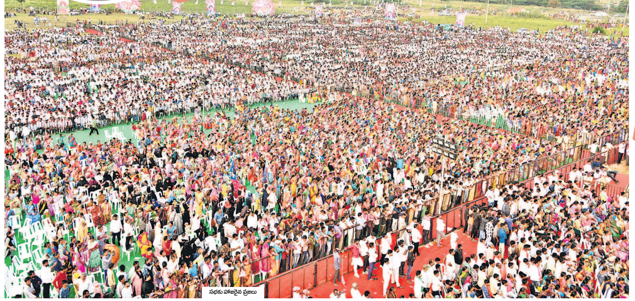
సభకు హాజరైన ప్రజలు