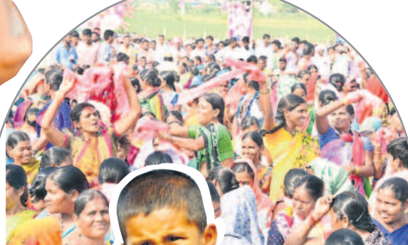
సభా ప్రాంగణంలో సృక్యం చేస్తున్న మహిళలు