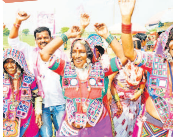
సభా ప్రాంగణంలో సృక్యం చేస్తున్న గిరిజన మహిళలు