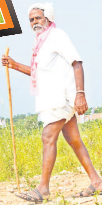
చేతి కర్ర సాయంతో సభకు వస్తున్న వృద్ధుడు