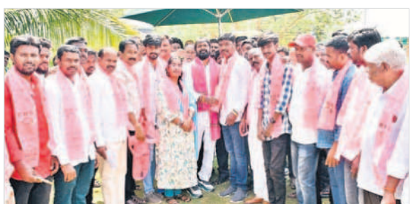
బీఆర్ఎస్ లో చేరిన వారికి గులాబి కండువలు కప్పతున్న మంత్రి శ్రీనివాస్ గౌడ్