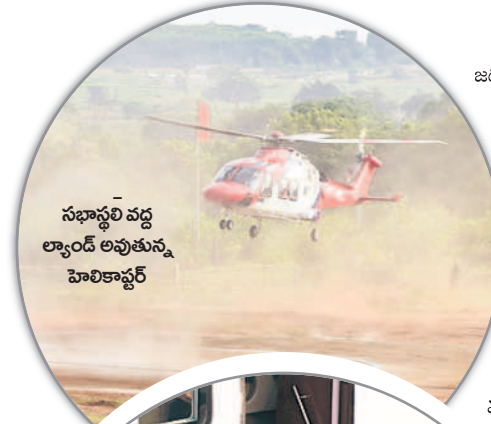
సభాస్థలి వద్ద ల్యాండ్ అవుతున్న హెలికాప్టర్