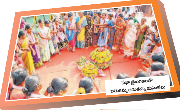
సభా ప్రాంగణంలో బతుకమ్మ ఆడుతున్న మహిళలు