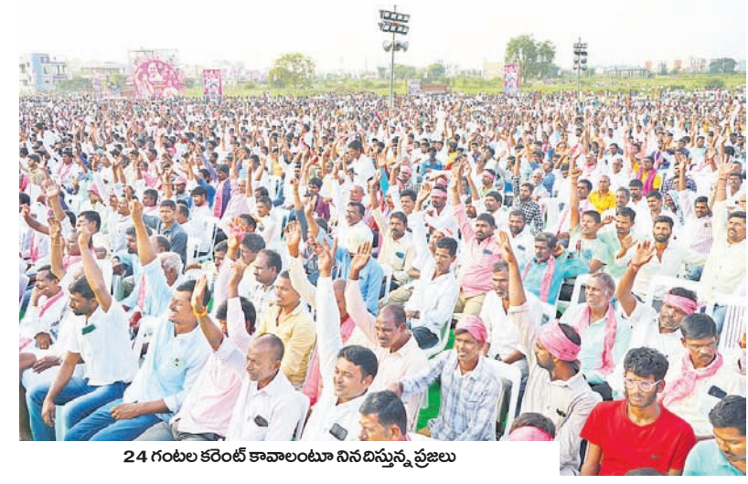
24 గంటల కరింటి కావాలంటూ నినదిస్తున్న ప్రజలు