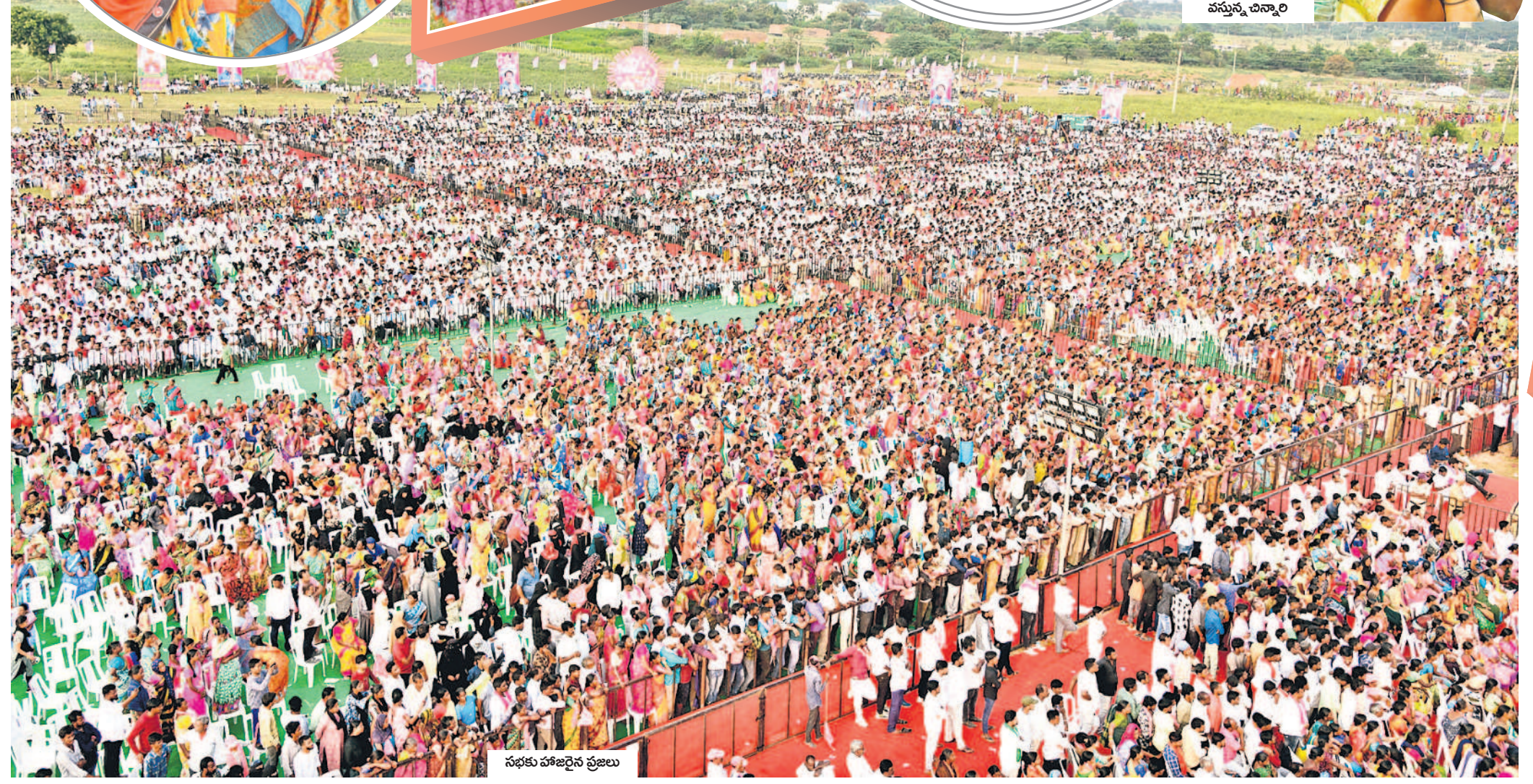
సభకు హాజరైన ప్రజలు