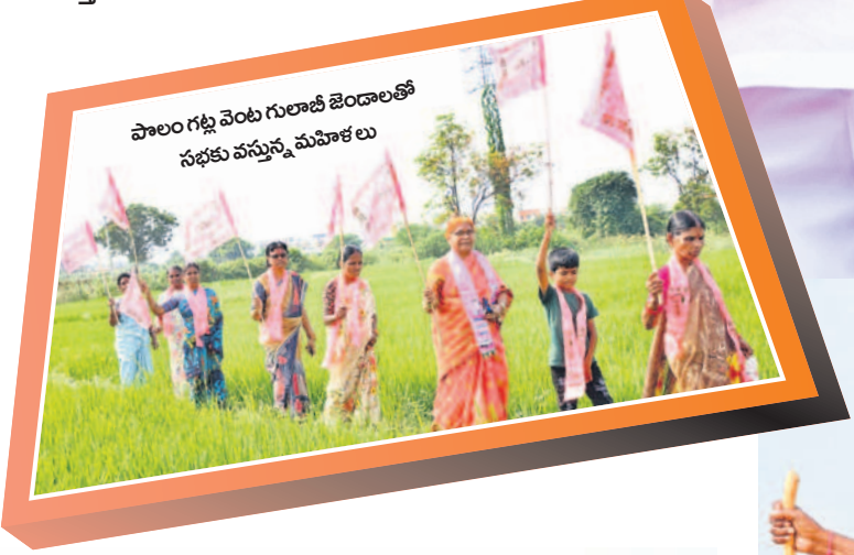
పాలం గట్టి వెంట గులాబీ జెండాల్తో సభకు వస్తున్న మహిళలు