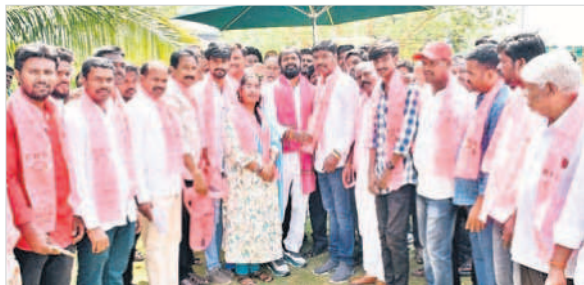
బీఆర్ఎస్ లో చేరిన వారికి గులాబి కండువలు కప్పతున్న మంత్రి శ్రీనివాస్ గౌడ్