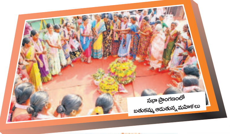
సభా ప్రాంగణంలో బతుకమ్మ ఆడుతున్న మహిళలు