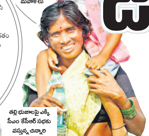
తల్లి భుజాలపై ఎక్కి సీఎం కేసీఆర్ సభకు వస్తున్న చిన్నారు