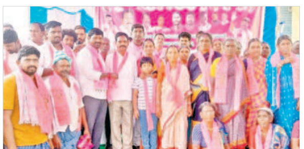
బీఆర్ఎస్లో చేరిన వారికి గులాబీ కండువలు కప్పితున్న విప్ గువ్వల బాలరాజు