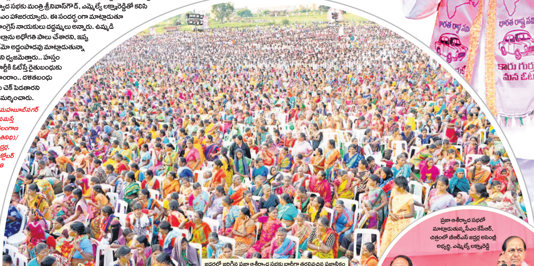
జడ్చర్లలో జరిగిన ప్రజా ఆశీర్వాద సభకు భారీగా తరలివచ్చిన ప్రజానీకం