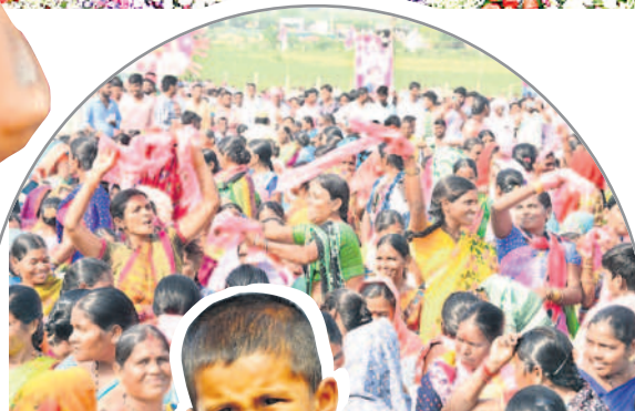
సభా ప్రాంగణంలో సృష్టించే వస్తున్న మహిళలు