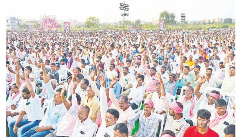
24 గంటల కరివెల కావాలంటూ నినదిస్తున్న ప్రజలు