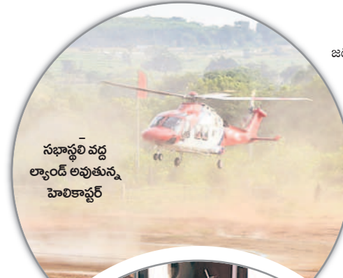
సభాస్థలి వద్ద ల్యాండ్ లాండు అవుతున్న హెలికాప్టర్