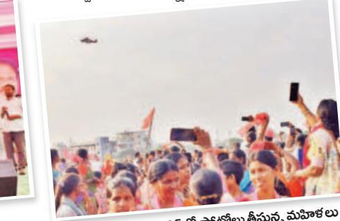
హెలికాప్టర్ ను సెల్ ఫోన్ లో ఫోటోలు తీస్తున్న మహిళలు

సీఎం కేసీఆర్ కు దట్టి కట్టారు. సీఎం కేసీఆర్ ప్రసంగిస్తున్నప్పుడు యువత ఉత్సాహంగా ఈలలు వేస్తూ నినాదాలు చేశారు. కాంగ్రెస్ వస్తే గ్యారంటీగా కరెంట్ కట్.. 24గంటల కరెంట్ ఉండాలనకునే వారు చేతులు ఎత్తాలని సీఎం కేసీఆర్ చెప్పగానే సభలో ఉన్న