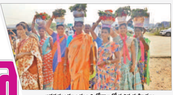
జడ్చర్ల మండలం నుంచి బీనాలతో వచ్చిన మహిళలు