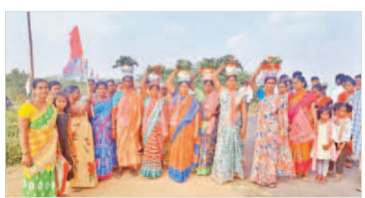
బీనాలతో సీఎం సభకు వస్తున్న గిరిజన మహిళలు