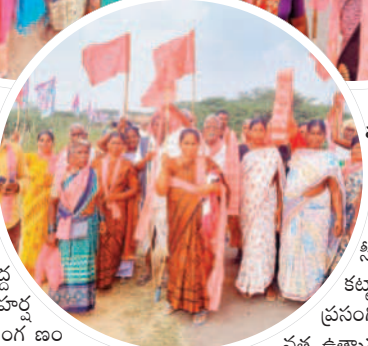
మిడ్డల్ మండలంలోని వివిధ గ్రామాల నుంచి వస్తున్న ప్రజలు