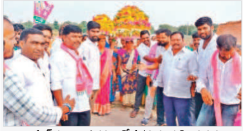
రాజుపూర్ నుంచి బతుకమ్మలతో సభకు వచ్చిన గొల్లకురుమలు

రాజుపూర్, అక్టోబర్ 18: జడ్చర్ల పట్టణంలోని బుధవారం నిర్వహించిన ప్రజా ఆశీర్వాద సభకు నియోజక వర్గంలోని జడ్చర్ల, నవాబ్ పేట, రాజుపూర్, బాలానగర్, మిడ్డల్, ఉర్కొండ మండలాలకు చెందిన వివిధ గ్రామాల ప్రజలు బీఆర్ఎస్ నాయకులు ఉత్సాహంతో తరలివచ్చారు. మహిళలు తెలంగాణ సంస్కృతికి ప్రతీకగా బోనాలు, బతుకమ్మలతో ఉర్రేగింపుగా తరలివచ్చారు. సభ ప్రాంగణంలో స్థలం సరిపోక చుట్టుపక్కల భవనాలపై కూర్చుని సీఎం కేసీఆర్ చేప్పే పదకాలను ఎంతో శ్రద్ధతో విన్నారు.