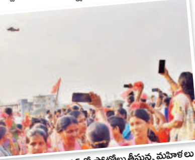
హెలికాప్టర్ ను సెల్ ఫోన్ లో ఫోటోలు తీస్తున్న మహిళలు

సీఎం కేసీఆర్ కు దట్టి కట్టారు. సీఎం కేసీఆర్ ప్రసంగిస్తున్నప్పుడు యువత ఉత్సాహంగా ఈలలు వేస్తూ నినాదాలు చేశారు. కాంగ్రెస్ వస్తే గ్యారంటీగా కరెంట్ కట్.. 24గంటల కరెంట్ ఉండాలనకునే వారు చేతులు ఎత్తాలని సీఎం కేసీఆర్ చెప్పగానే సభలో ఉన్న