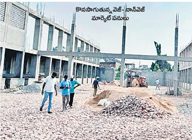
కొనసాగుతున్న వెజ్-నాన్ వెజ్ మార్కెట్ పనులు

రాత్రంతో వాలు దారులన్ని చీకడలు.. తాగునీటి కోసం ఇక్కట్లు.. సరైన వైద్య పనులు లేక రోగుల బాధలు.. దుర్గంధం వెదజల్లే రోడ్లు, మురికి కాలువలు.. ఇది మేజర్ గ్రామ పంచాయతీగా ఉన్నప్పటి భీమ్గల్ దుస్థితి. సమైక్య పాలనలో ఎన్నో ప్రభుత్వాల పంచాయి కానీ.. భీమ్గల్ వాసుల కష్టాలు తీరలేదు. తెలంగాణ ఏర్పాటు అనంతరం భీమ్గల్ ప్రజల సమస్యలు పరిష్కారంపై ప్రజలు తొమ్మిదేండ్లలో అధ్యల ముసే రోడ్డు చేశారు. తాగునీటి కష్టాలు తీరాయి. కాంటిన్ల సీసీ రోడ్లు, డ్రైనేజీల నిర్మాణం, వీధులన్ని ఎలెక్ట్రీటీ లైట్లతో జగలేమనలా తయారయ్యాయి. స్వరాష్ట్రంలో ఏర్పడిన తొలి ప్రభుత్వం చేపట్టిన అభివృద్ధి పనులతో భీమ్గల్ వాసులు హర్షం వ్యక్తంచేస్తున్నారు.