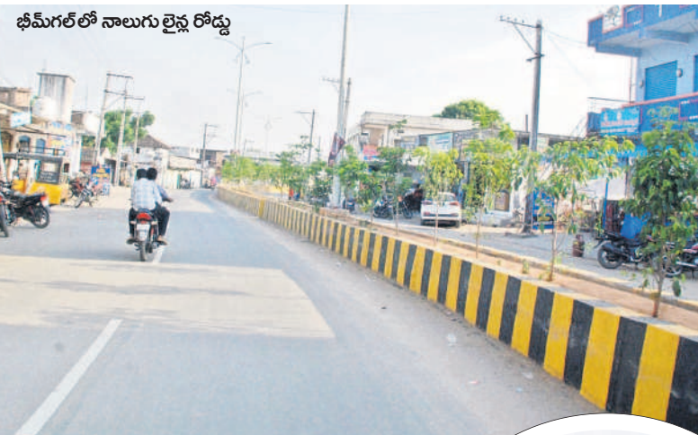
భీమ్గల్ నాలుగు లైన్ల రోడ్డు

రూ.26కోట్లతో డబుల్ రోడ్డు.. భీమ్గల్ పట్టణంలో రూదారుల నిర్మాణం, డివై డడ్డు, సెంట్రల్ లైటింగ్ కోసం రాష్ట్ర ప్రభుత్వం మొదలు రూ.18కోట్లను మంజూరు చేసింది. దీంతో పనులు పూర్తికాగా, మంత్రి వేముల చౌరవతో మరో రూ.8కోట్లను కేటాయింబి అనధంగా 1.5కిలోమీటర్ల మేర పనులను చేపట్టారు. దీంతో రాత్రిపూయంలో పట్టణంలోని రూదారులన్ని వేగాలు విజయవంతమైతాయి. పట్టణంలోని 12 వార్డుల్లో 2100ఎలెక్ట్రీటీ బిల్లులను బిగించారు.