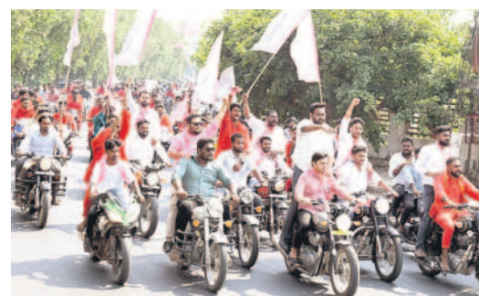
నగరంలో బీఆర్ఎస్ శ్రేణుల బైక్ర్యాలీ

తాను చేసిన అభివృద్ధి పనుల గురించి మంత్రి గంగుల ప్రజలకు వివరించారు. తెలంగాణ వచ్చిన తర్వాత ఎంత సులువుగా కోట్లాది నిధులు ఇచ్చింది చాలా స్పష్టంగా అర్థం చేయించారు. కౌన్సిలర్గా ఉన్నా, కార్పొరేటర్గా ఉన్నా, ఎమ్మెల్యే, మంత్రిగా ఉన్నా అప్పటికి ఇప్పటికీ ఒకే తీరుగా ఉన్నానని, ఒక అన్నగా, తమ్ముడిగా, కొడుకుగా ప్రజల మధ్యనే ఉన్నానని గంగుల చేసిన ప్రసంగం జనాలను ఆకట్టుకుంది. సభకు భారీగా జనం తరలి రావడంతో గంగుల గెలుపు సల్లేరుపై నడకే అన్నట్లుగా అనిపించింది.