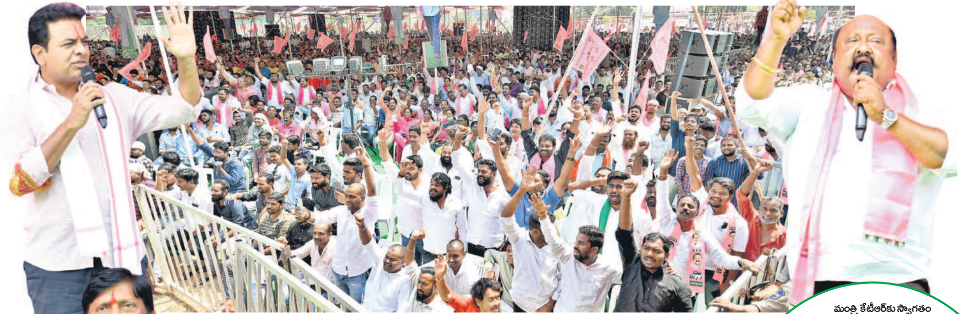
కరీంనగర్: ఆశీర్వాద సభకు సభకు హాజరైన జనం, ప్రసంగిస్తున్న మంత్రి కేటీఆర్, రాష్ట్ర ప్రజాశాసక సంఘం ఉపాధ్యక్షుడు వినోద్ కుమార్, బీఆర్ఎస్ అభ్యర్థి, మంత్రి గంగుల కమలాకర్