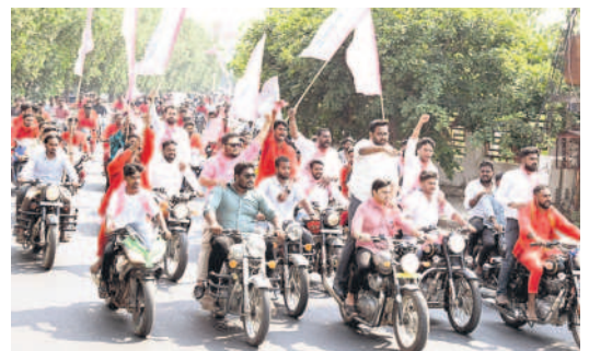
నగరంలో బీఆర్ఎస్ శ్రేణుల బైక్ ర్యాలీ

తాను చేసిన అభివృద్ధి పనుల గురించి మంత్రి గంగుల ప్రజలకు వివరించారు. తెలంగాణ వచ్చిన తర్వాత ఎంత సులువుగా కోట్లాది నిధులు ఇచ్చింది చాలా స్పష్టంగా అర్థం చేయించారు. కౌన్సిలర్ గా ఉన్నా, కార్పొరేటర్ గా ఉన్నా, ఎమ్మెల్యే, మంత్రిగా ఉన్నా అప్పటికి ఇప్పటికీ ఒకే తీరుగా ఉన్నానని, ఒక అన్నగా, తమ్ముడిగా, కొడుకుగా ప్రజల మధ్యనే ఉన్నానని గంగుల చేసిన ప్రసంగం జనాలను ఆకట్టుకుంది. సభకు భారీగా జనం తరలి రావడంతో గంగుల గెలుపు సల్లేరుపై నడకే అన్నట్లుగా అనిపించింది.