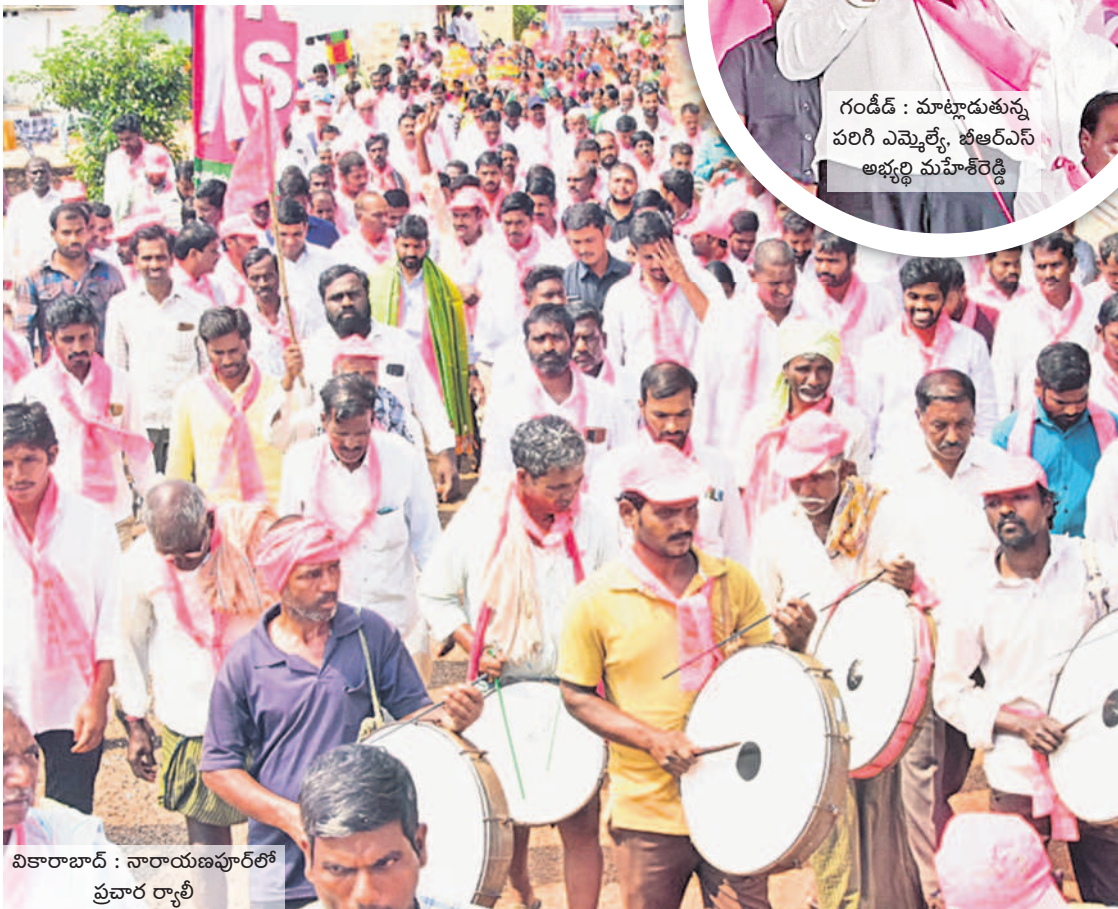
వికారాబాద్ : నారాయణపూర్ లో ప్రచార ర్యాలీ