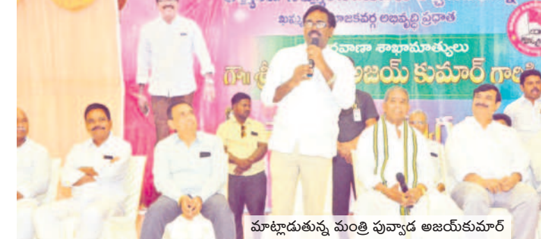
మాట్లాడుతున్న మంత్రి పువ్వాడ అజయ్ కుమార్

రాష్ట్ర రవాణాశాఖ మంత్రి పువ్వాడ అజయ్ కుమార్