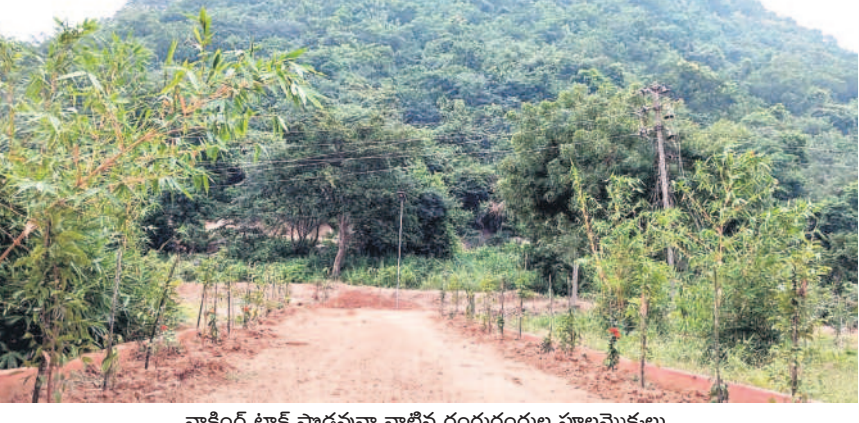
వాకింగ్ ట్రాక్ పాదవునా నాటిన రంగురంగుల పూలమొక్కలు