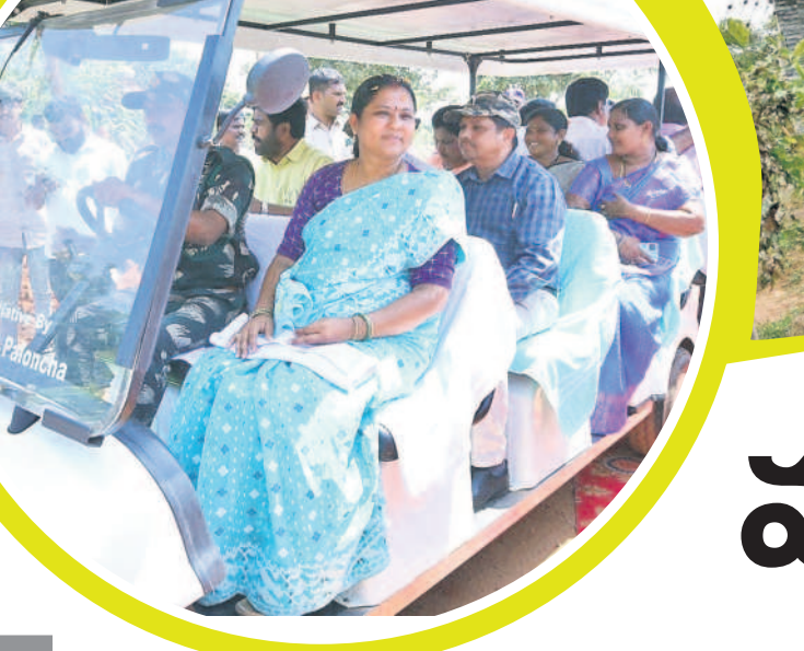
ప్రకృతి అందాలను వీక్షిస్తున్న ఎమ్మెల్యే, అటవీశాఖాధికారులు