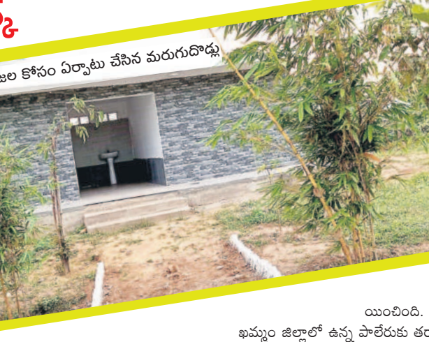
పార్కులో ప్రజల కోసం ఏర్పాటు చేసిన పురుగుదొడ్లు