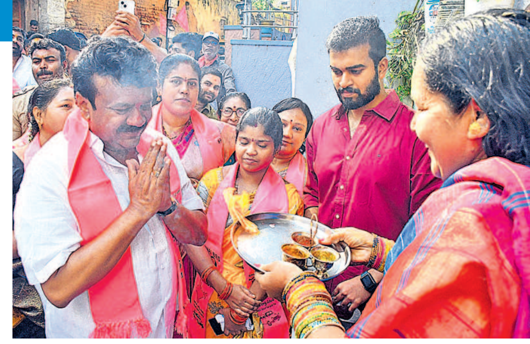
మోదా డివిజన్ లో మంత్రి తలసాని శ్రీనివాసయ్యారావు హాజరై భజనం

సిటిబ్యూరో, అక్టోబర్ 19 (సమస్త తెలంగాణ) : ఎన్నికల సమరంలో వారీ వనీ సైడ్ అన్నట్టుగా 'కారు' టాప్ గేర్ లో దూసుకుపోతున్నది. బరిలో నిలిచే అభ్యర్థుల్లో ఎవరో తెల్లగా బీజేపీ పార్టీ ప్రకటించిన టోలి జాబితాతోనే అంధత్వపు జ్యూలతో కకావీలవపుతున్న కాంగ్రెస్ మరోవైపు ఉంటే... అధికార పార్టీ బీఆర్ఎస్ అభ్యర్థులు మాత్రం ప్రచారంలో దూసుకుపోతున్నారు. ఇప్పటికే టోలి దళంలో నియోజకవర్గాన్ని చుట్టేసిన గులాబీ అభ్యర్థులు.. రెండో విడతలో గడ పగడముకు పాదయాత్రలు చేపడుతున్నారు. ఆసక్తికరమైన లీడరు అందరూ ఒక్కొక్కటిగా కలిసికట్టుగా ప్రచార పర్యాటకం కొనసాగిస్తూ విపక్ష పార్టీలకు వణుకు పుట్టిస్తున్నారు. ఈ నేపథ్యంలో నియోజకవర్గంలో గులాబీ ప్రచారం పండగ వాతావరణంలో కొనసాగుతుండగా.. బరిలో ప్రతిపక్ష పార్టీ అనేది ముచ్చటైనా కనబడడం లేదు. షెడ్యూల్ వెలువడి 11 రోజులు గడిచినా.. కాంగ్రెస్, బీజేపీ ఎన్నికల