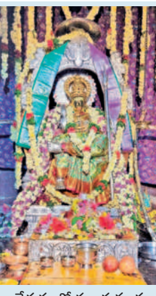
కాళేశ్వరంలో స్కంద మాత అలంకరణలో పాల్గొంటుంది