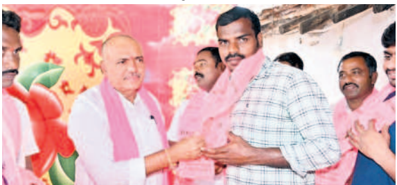
గణపూరు: బీఆర్ఎస్లో చేరిన పరశురాంపల్లి గ్రామానికి చెందిన బీజేపీ, కాంగ్రెస్ యూత్ కార్యకర్తలను ఆహ్వానిస్తున్న ఎమ్మెల్యే గండ