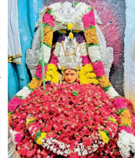
లక్ష్మీ పుష్కారం అనంతరం పద్మాక్షి అమ్మవారు