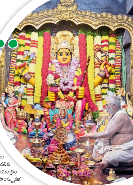
లలితా మహా త్రిపుర సుందరీ దేవి అలంకారంలో భద్రకాళీ అమ్మవారు